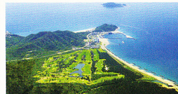
伊良湖シーサイドゴルフ倶楽部