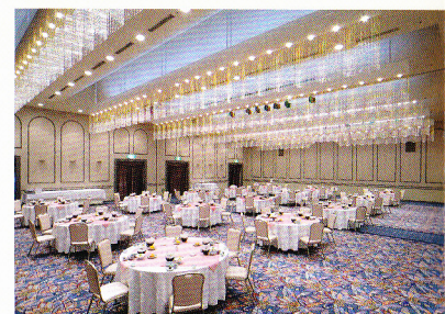
バンケットホール「オーキッド」

400名規模の大宴会から 5～6名のご宴会まで、 幅広く対応できる 和・洋2タイプ、 5つの宴会場を完備。 幹事長様をサポートする お手軽・お得なプランも ご用意しています。