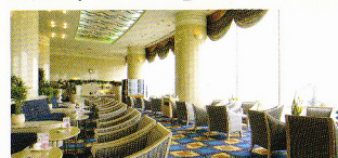
ティーラウンジ「ラ・メール」