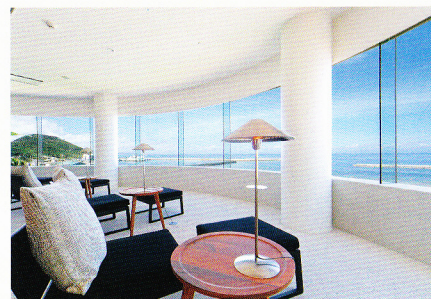
リラクゼーション・エリア