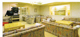
カラオケサロン「サンセット」