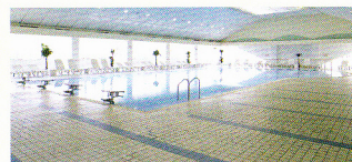
屋内プール「ブーゲンビリア」