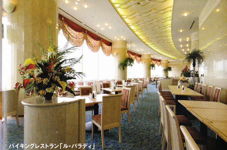
バイキングレストラン「ル・パラディ」