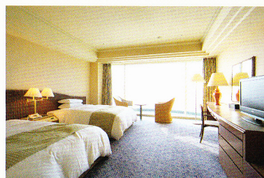
スーパーアツインルーム