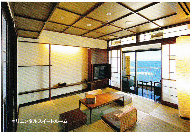
オリエンタルスイートルーム