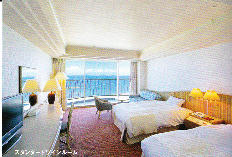
スタンダードツインルーム