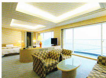
ジュニアスイートルーム

10タイプあるお部屋は、すべてオーシャンビューの寛ぎ。 どこまでも碧く広がる海の寛ぎとやすらぎ、そして 心地よい空間が演出するリゾートライフをお楽しみください。