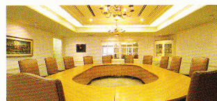
会議室「サンライズ」