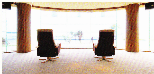
ヒーリングルーム